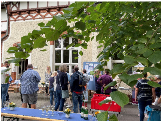
Viele Besucher informierten sich am Tag der offenen Tür zu Fragen und Angeboten rund um das Thema Palliativmedizin.

Die Pfeifferschen Stiftungen sind mit ca. 1.900 Mitarbeitenden die größte diakonische Komplexeinrichtung in Sachsen-Anhalt. Zwei Krankenhäuser sowie ein Medizinisches Versorgungszentrum (MVZ), ambulante Pflegedienste und Wohnangebote für Menschen mit Behinderung und Senioren gehören ebenso dazu wie eine Werkstatt für Menschen mit Behinderung mit etwa 600 Beschäftigten, stationäre und ambulante Altenpflege, eine in Deutschland einzigartige Hospizarbeit sowie ein Bildungszentrum für Gesundheits- und Pflegeberufe (50 Prozent Beteiligung) und ein Sozialpädiatrisches Zentrum (52 Prozent Beteiligung).